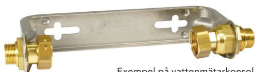
Exempel på vattenmätarkonsol