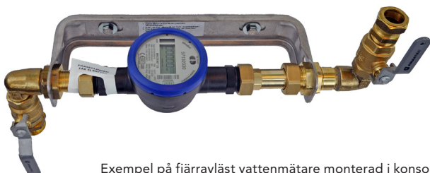
Exempel på fjärravläst vattenmätare monterad i konsol

Om vattenmätaren behöver tas ned på grund av frostrisk eller annan orsak måste fastighetsägaren alltid kontakta Miva.